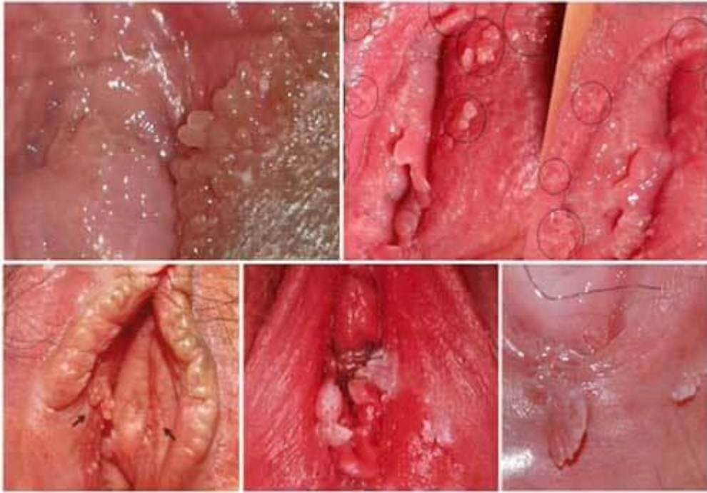
- Hình ảnh sùi mào gà tại nữ